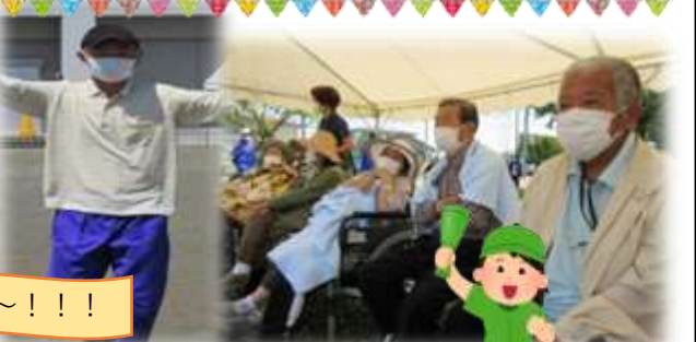
快晴！暑かったですね(*_*)