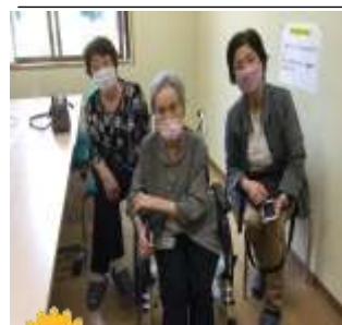
遠方からお越しいただきありがとうございました。

新型コロナウイルスの感染状況に落ち着きが見られた六月から七月の初旬にかけて、特養では心待ちにしていた面会制限が解除となりました。面会条件はあるものの、多くの皆様から電話をいただき、お越しいただけたこと本当に嬉しく思っております。どうしても窓越しでは顔が見れるだけで嬉しいと言った気持ちもありますが、いろいろ伝わらない事も多々あり、皆様も歯痒い想いをされたことと思います。結果的に短い期間にはなりましたが、ご家族様と久しぶりに再会し嬉しそうな入居者様の表情が見れたことがなにより嬉しく、これがあたりまえの日常だったことを実感したのでした。今後とも感染状況に合わせた面会をより良いカタチで実施できるように努めさせていただきます。あたりまえの日常に早く戻りますように。