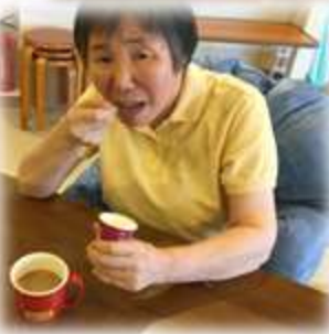
夏はアイスですね～ 美味しい！！