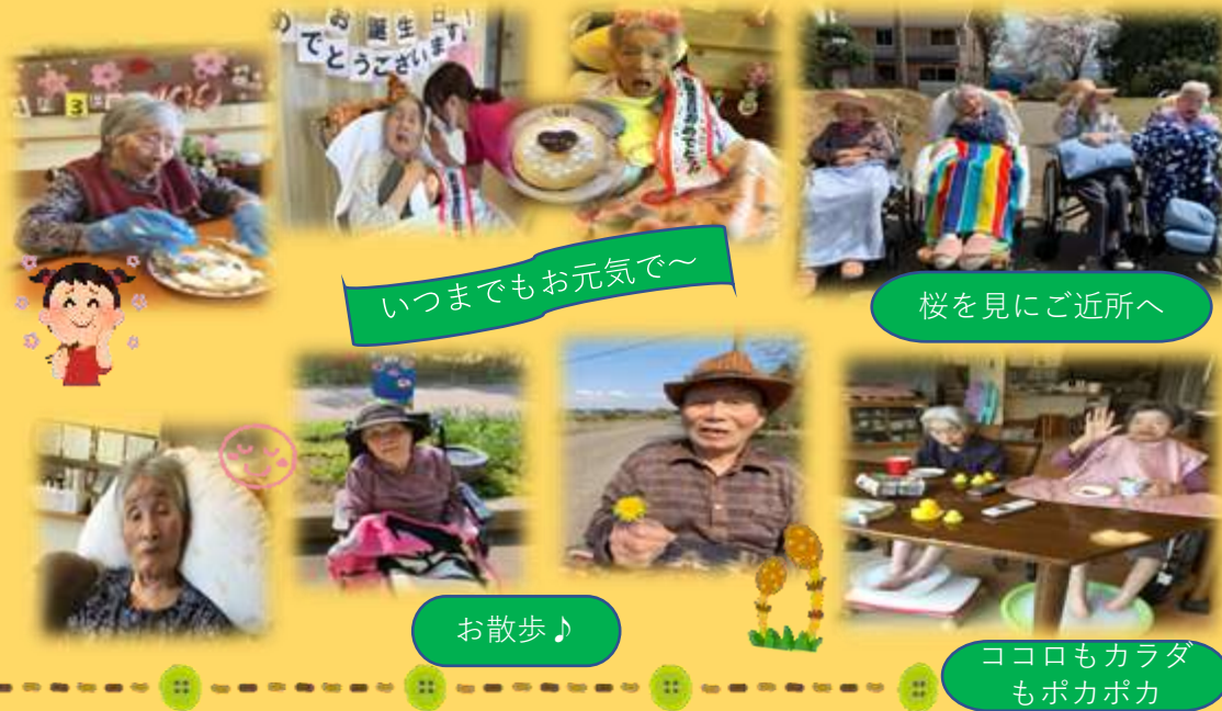
いつまでもお元気で~

星組 の皆さんの様子です。外に出れなければ中で楽しもう!と足湯を計画。それもスイーツを召し上がりながらです。ある意味施設だからこそのできた事だったかもしれません。ちよっとした工夫で皆さんに実感していただけることはまだまだたくさんあると思うので、これからもいろいろと計画していきたいと思えます!