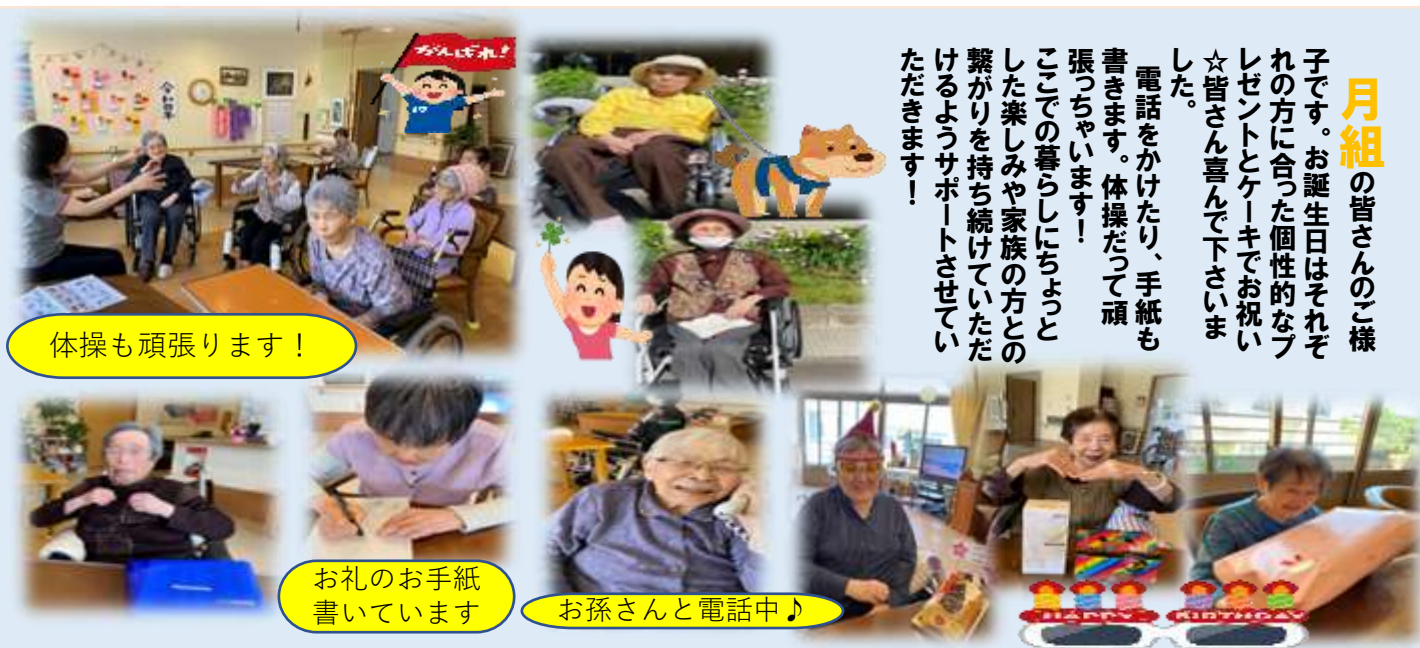
体操も頑張ります!

月組 の皆さんの様子です。お誕生日はそれぞれの方に合った個性的なプレゼントとケーキでお祝い☆皆さん喜んで下さいました。 電話をかけたがり、手紙も書きます。体操だって頑張り張っちゃいます! ここでの暮らしにちよっとした楽しみや家族の方との繋がりを持ち続けていたいただけるようサポートさせていただきます!