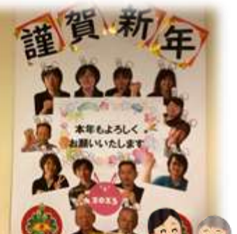
私に任せておかない！と、皆さん家事はお手の物 GOOD! 今年も一緒に頑張ります