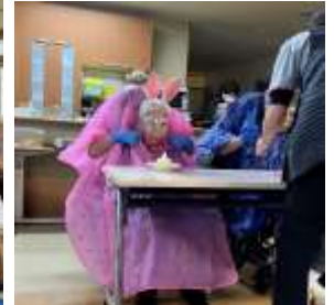
3年ぶりのもちつき大会 みなさんまだまだ現役です☺️二人羽織も全く汚れずペロリ🍰