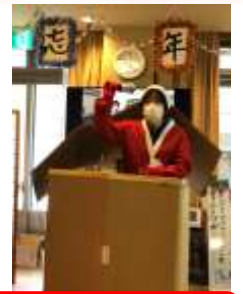
KAZU&見習いサンタのマジックショー