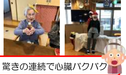
驚きの連続で心臓バクバク