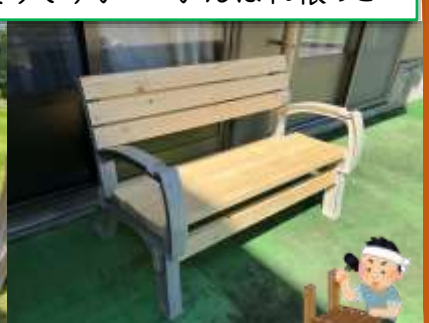
ベンチは男に任せとけ! と、紙ヤスリで平らにし、組み立て、最後に塗装で手作りベンチの完成