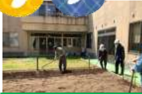
仲良く(?)言い合い ながら畝作り