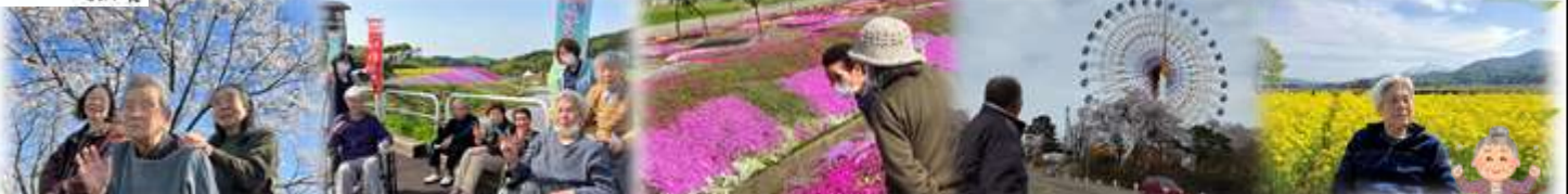
春を満喫したく、三和・板倉・松が峰などなど、そこら中を飛び回り、癒しと元気をもらってきました