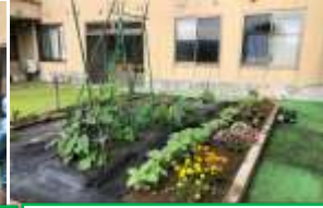
畑とお花のコラボレーション 新しい中庭が完成!! 芝桜枯れそうですが... がんばれ根っこ