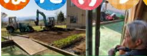
中庭リニュー~アル~ を撮影する元カメラマン