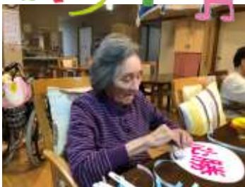
今年の三郷地区運動会には手作りうちわ を80枚作り参戦。 地域の皆さんのお役に立てて光栄です