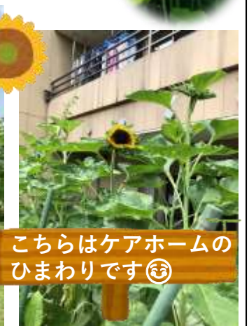
こちらはケアホームのひまわりです☺