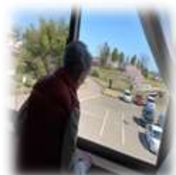
お部屋からは桜も見えます。