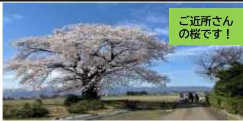
ご近所さんの桜です!