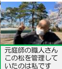
元庭師の職人さん この松を管理していたのは私です