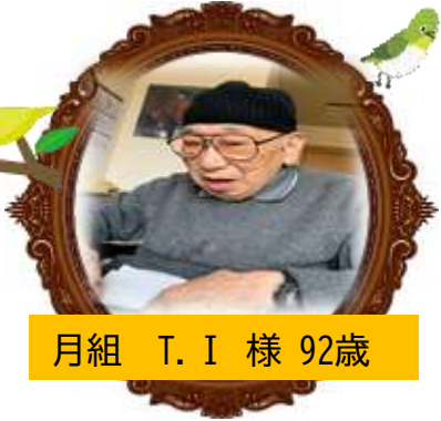
月組 T. I 様 92歳