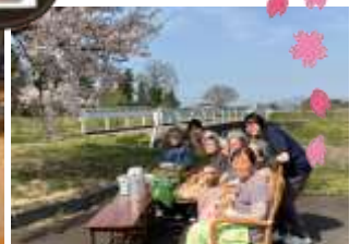
元お茶の先生も感心 大変美味しゅうございました