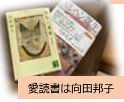
愛読書は向田邦子

現在笛吹の里特養は要介護2から5の方が自身のペースや自分らしさを大事に生活されています。あたり前の生活を継続しながら、皆さんのやりたいことや想いに向き合い、一緒に実現できるようにお手伝いさせていただきます！