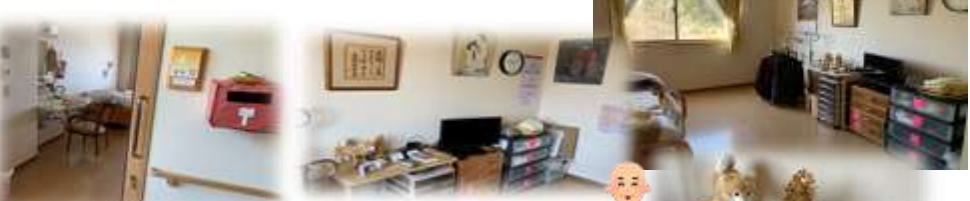
お部屋の入り口にはこんなかわいいポストが！