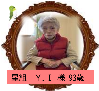
星組 Y. I 様 93歳

改めまして！こちら三郷地区薮野のとてものどかな場所にある施設『 笛吹の里 』です。この時期に散歩に出かけると上の写真のような景色がいたるところで見られます。桜の次は田園風景もこれまた楽しみのひとつです。今現在29名の入居者様が自身のリズムでのびのびと生活されています。小さな施設なのでアットホーム♡皆が馴染みの関係でとても居心地の良い場所です。入居者様はもちろん関わる皆が幸せであることを目標にココロもカラダも動く1年になるよう 頑張るよりも楽しんで！ 皆で取り組んでいきたいと思ひます。